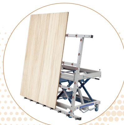
HS300 Midi met afneembaar zwenkbaar ligraam